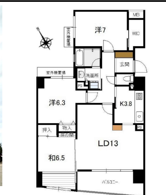
実際の間取と若干異なる場合がございます。その際は現状を優先させていただきますのでご了承下さい。