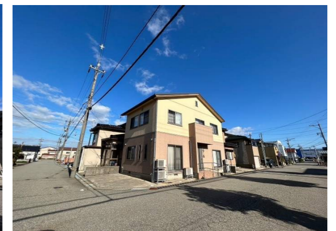
実際の間取と若干異なる場合がございます。 その際は現状を優先させていただきますのでご了承下さい。